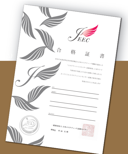
JEOマークの入ったJECC合格証書